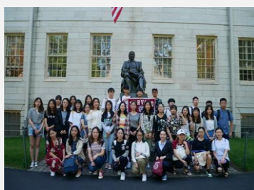
哈佛大学校园合影

项目期间，学员还将在哈佛大学与麻省理工学院等高校进行校园参访与本地学生进行交流对话等活动，分享在世界顶级高校的留学生活。