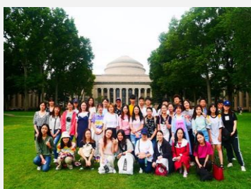
麻省理工学院校园合影