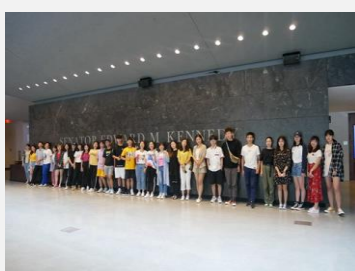
肯尼迪政法研究中心