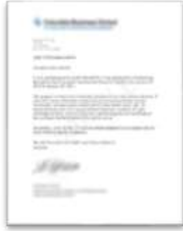
学员推荐证明信(示例)