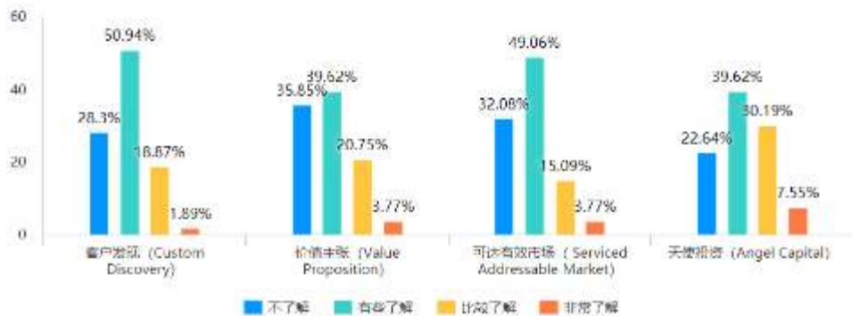
图2 课前知识掌握程度

对比课前（图2）和课后（图3）的专业知识掌握程度，学生对课程部分核心知识点的掌握程度显著提高。说明本项目达到了预设的教学目标。