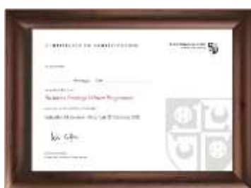
剑桥大学格顿学院 结业证书

说明：报名帝国理工项目的同学可以选择一个企业远程实习免费参加，可选企业包括：科锐国际、新加坡 W.I.金融科技、德安咨询、保诚等等企业。