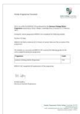
剑桥大学格顿学院 成绩评定报告