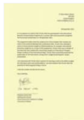
剑桥大学导师签发优秀小组嘉奖信