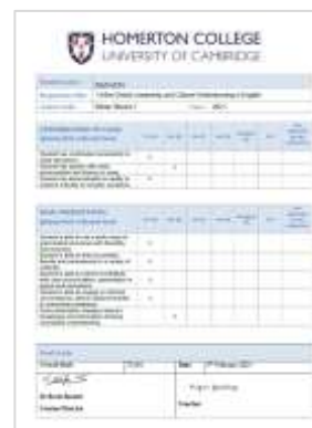
剑桥大学哈默顿学院 成绩评定报告