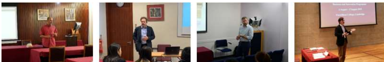
剑桥大学格顿学院专业课程导师