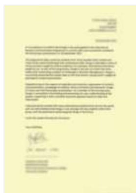
剑桥大学导师签发推荐信