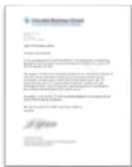
学员推荐证明信(示例)