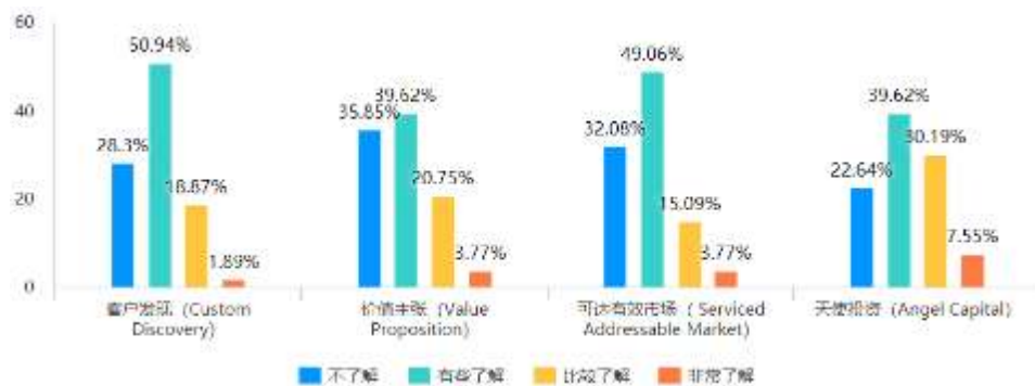
图2 课前知识掌握程度

对比课前（图2）和课后（图3）的专业知识掌握程度，学生对课程部分核心知识点的掌握程度显著提高。说明本项目达到了预设的教学目标。