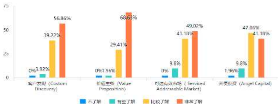
图 3 课后知识掌握程度