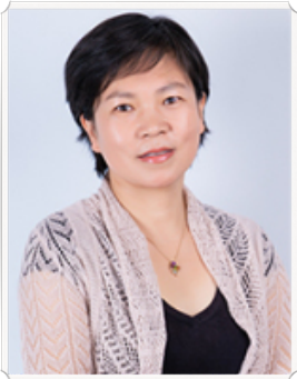
Prof. Y. L.