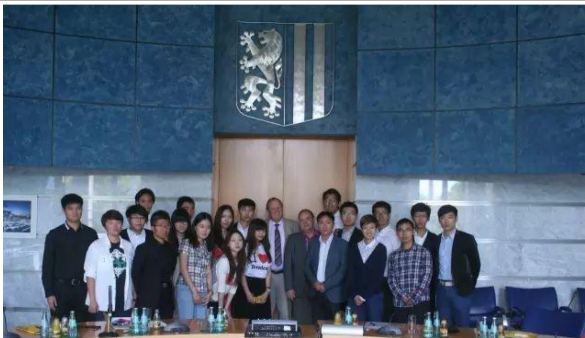
德累斯顿市长、议员接见来访同学

在市政厅真实的会议室内，德累斯顿市市长亲自接见来访同学，介绍德累斯顿的情况。会议桌布置，议员陪同，秘书引荐，互赠礼物，相互沟通，记者拍照，最后登上当地报纸。所有流程都和接待其他州级市级外国来访团一样，绝非一般的体验。