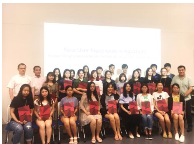
(往届线下课程结业证书颁发现场)